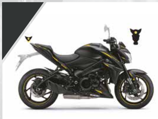
Carbone Jaune : 99F00-KDGSX-S12