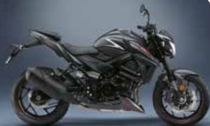
Argent : 990D0-13K06-SLV