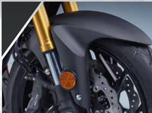
12 / GARDE BOUE AVANT CARBONE 990D0-13K90-CRB