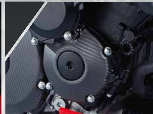
14 / PROTECTION CARTER DROIT CARBONE 990D0-13K26-CRB