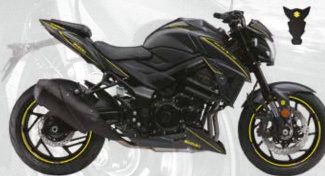
Carbone / Jaune : 99F00-KGSXS-003