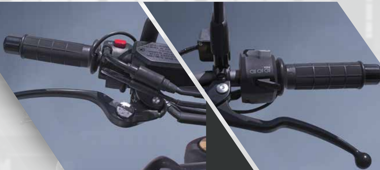
20 / LEVIER DE FREIN NOIR 57300-29G40-000