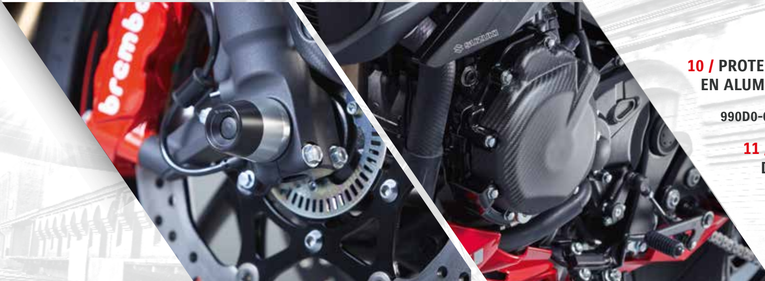
10 / PROTECTION AXE DE ROUE AVANT EN ALUMINIUM ET TEFLON