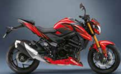
22 / KIT STICKERS DE PROTECTION COMPLET Transparent / Noir : 990D0-13K06-BLK