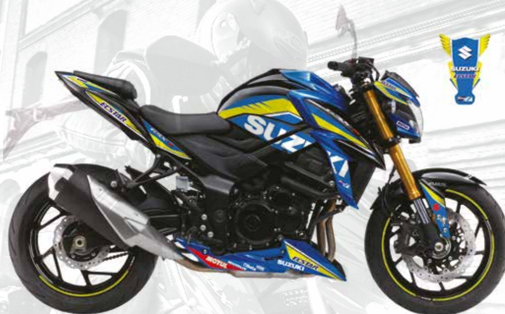
16 / KIT STICKERS MOTO GP Replica : 99F00-KGSXS-012