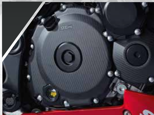
13 / PROTECTION CARTER D'EMBRAYAGE CARBONE 990D0-13K25-CRB