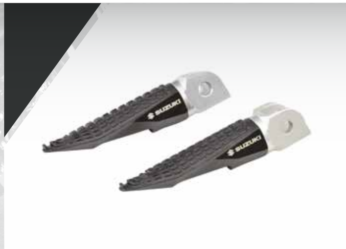
2 / KIT REPOSE PIEDS AVANTS ET ARRIÈRES 99F00-RPGSX-S02