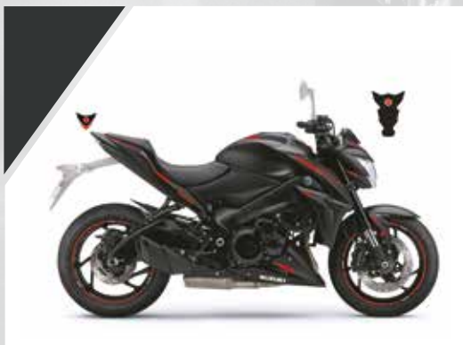
Carbone Rouge : 99F00-KDGSX-S11

Pour GSX-S1000F Carbone. 990D0-04K50-CRB