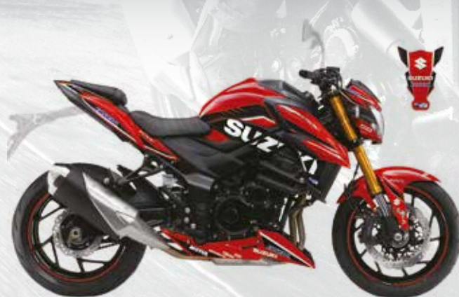
Rouge / Noir : 99F00-KGSXS-011