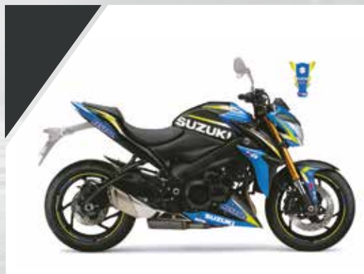
GP Replica : 99F00-KDGSX-S13