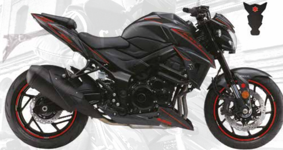
17 / KIT STICKERS CARBONE Carbone / Rouge : 99F00-KGSXS-001