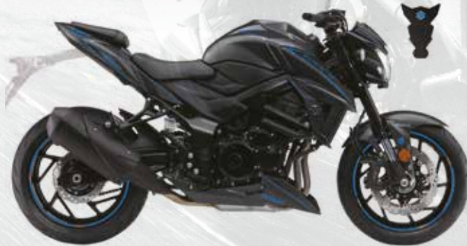
Carbone / Bleu : 99F00-KGSXS-005