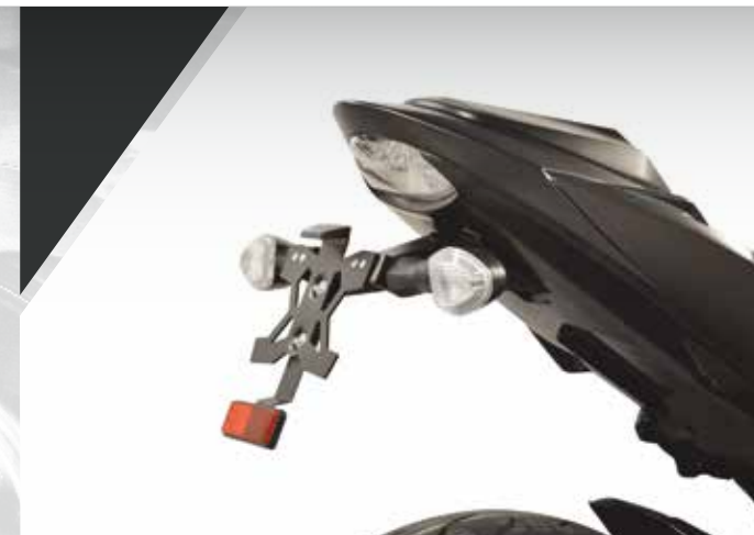
3 / SUPPORT DE PLAQUE HOMOLOGUE 99F00-SPGSX-S03