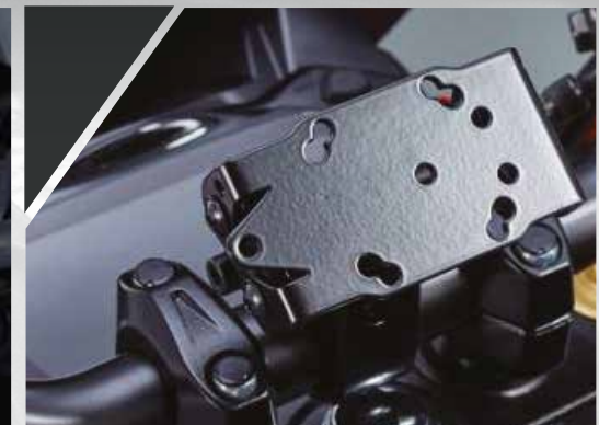
15 / SUPPORT GPS 990D0-31JNB-000