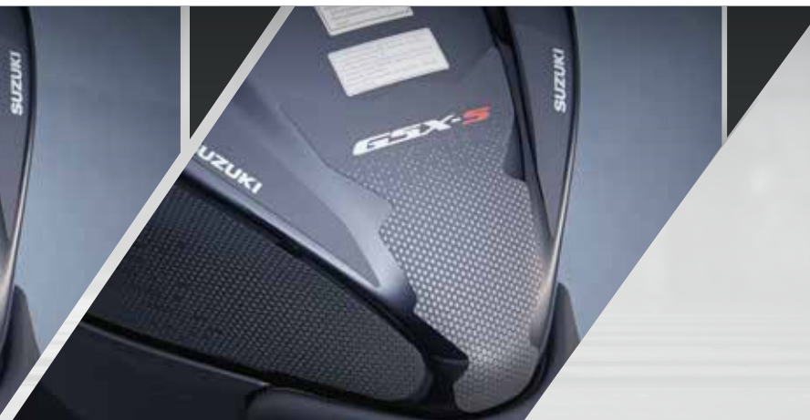
Noir avec logo horizontal GSX-S. 990D0-04KA1-PAD