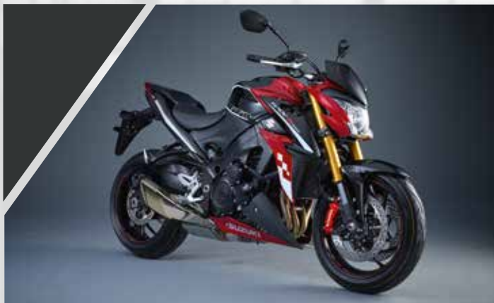
Damier Blanc : 990D0-04K07-PAD