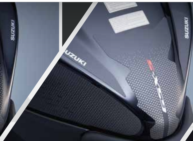
Noir avec logo vertical GSX-S. 990D0-04KB1-PAD