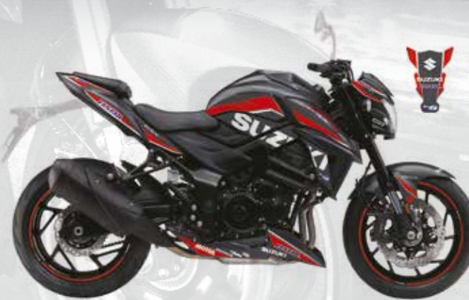
Noir / Rouge : 99F00-KGSXS-007