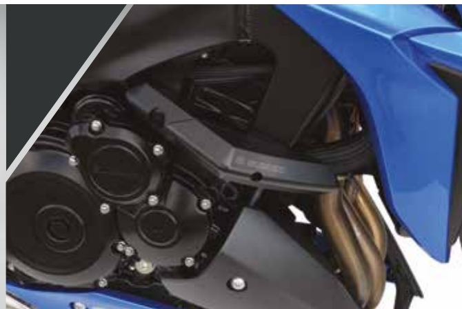
22 / KIT PATINS DE PROTECTION ALUMINIUM ET TEFLON GSX-S1000 : 99F00-KGSXS-00S GSX-S1000F : 99F00-KGSXS-00F