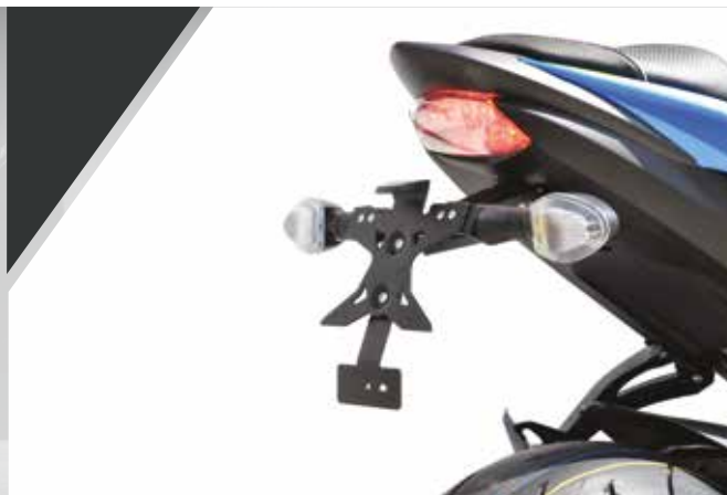
23 / SUPPORT DE PLAQUE HOMOLOGUE Métal avec éclairage LED. 99F00-SGSXS-001