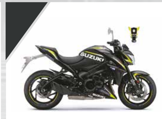
GP Jaune : 99F00-KDGSX-S14