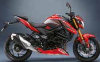
Gris : 990D0-13K06-GRY