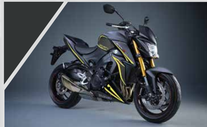
Jaune : 990D0-04K08-PAD