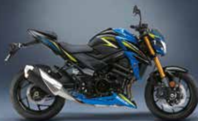
Jaune / Noir : 990D0-13K06-YEL