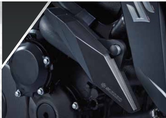
1 / KIT PATINS DE PROTECTION EN ALUMINIUM ET TEFLON 99F00-PPGSX-S01