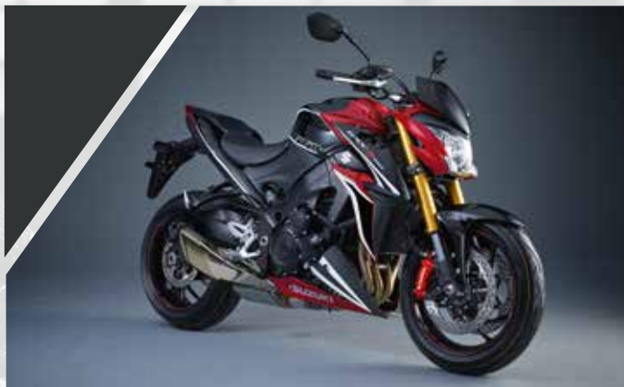
Blanc : 990D0-04K09-PAD