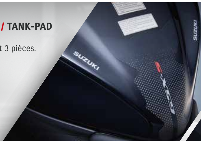
Transparent avec logo vertical GSX-S 990D0-04K01-PAD