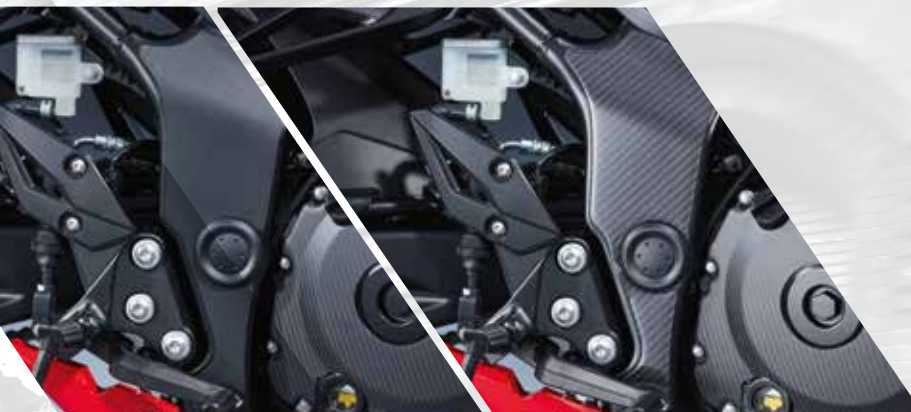
23 / STICKERS DE PROTECTION CADRE